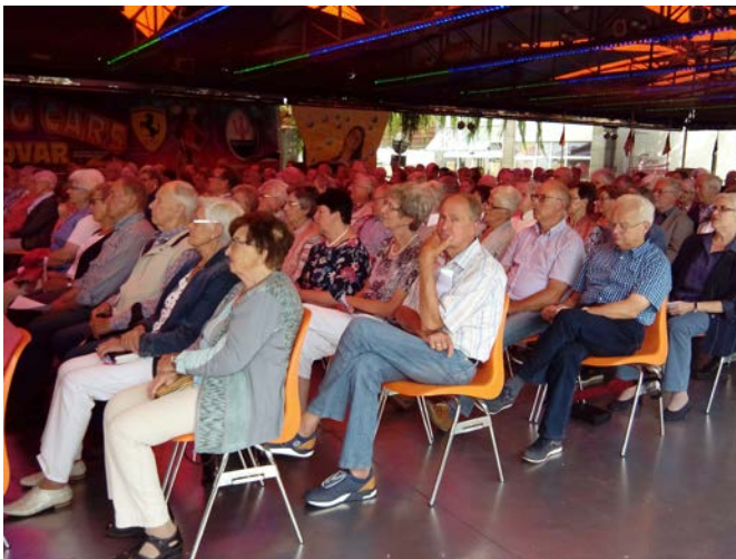
Bilder vom Kirmesgottesdienst in Laggenbeck